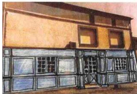
Type de façade souhaitée