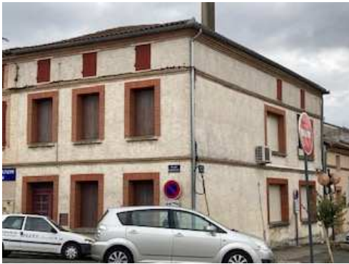
Photo du bâtiment actuel

Tel 05.63.67.30.21. – Mail mairie@ville-grisolles82.fr