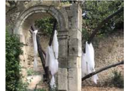
Visuel : Alba Sagols, Care drain , 2020, production pour Horizons d'eaux #4 , parcours réalisé par les Abattoirs, Musée - Frac Occitanie Toulouse et le Frac Occitanie Montpellier © Alba Sagols

Care drain , dont l'expression désigne les mouvements migratoires d'individus qui travaillent dans le soin, découle de la rencontre avec un arbre souffrant du parc d'Ayguesvives. Dans une démarche reliée à l'éthique de la sollicitude, cette installation fantomatique résulte d'une performance ritualisée de prise de soin d'un arbre touché par la foudre. Sa forme réfère aux pratiques païennes des arbres à loques, sur lesquels on accrochait les vêtements d'une personne malade dans l'espoir de sa guérison ou d'un soulagement, notamment pendant les épidémies de peste. Elle répond ainsi à des questionnements liés à notre rapport au vivant dans un contexte de crise sanitaire, écologique et sociale, où elle vient incarner une symbolique du care . Le film issu de cet événement, visible via QR Code, aborde de manière horizontale des points de vue sur différentes échelles du vivant présent dans l'environnement direct de l'arbre.