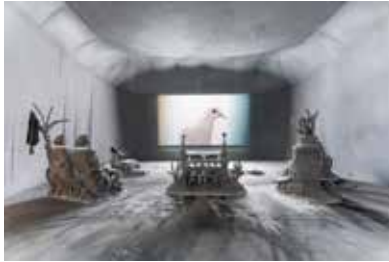
Exhibition view at Les Abattoirs, Musée - Frac Occitanie Toulouse de Laure Prouvost, Deep See Blue Surrounding You / Vois ce bleu profond te fondre , from January 24th to May 31st 2019 © Galerie Nathalie Obadia, carlier | gebauer, Lisson Gallery ; photo : B. Conte

Toulouse (Haute-Garonne) Jusqu'au 20 septembre 2020