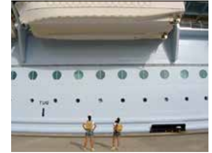
Visuel : Becquemin & Sagot, Bigger; Road-movie cruise - until the end of the world #forever , 2020, production pour Horizons d'eaux #4 , parcours réalisé par les Abattoirs, Musée - Frac Occitanie Toulouse et le Frac Occitanie Montpellier © Becquemin & Sagot

Œuvre issue de Road-movie cruise - until the end of the world #forever , installation (sculpture textile, bande son), 2020, courtesy H Gallery