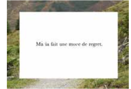
Visuel : Sarah Vialle, 2020, production pour Horizons d'eaux #4, parcours réalisé par les Abattoirs, Musée - Frac Occitanie Toulouse et le Frac Occitanie Montpellier

Édition de 60 drapeaux distribués par l'Office du Tourisme Le Somail pour la flotte du canal du Midi, 2020