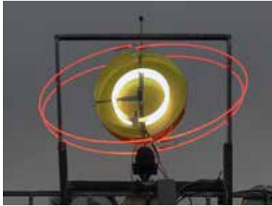
Visuel : Rémi Groussin, Black Sun Motel , 2020, production pour Horizons d'eaux #4 , parcours réalisé par les Abattoirs, Musée - Frac Occitanie Toulouse et le Frac Occitanie Montpellier

Grisolles (Tarn-et-Garonne) Berges du canal latéral 19 juillet – 21 septembre 2020