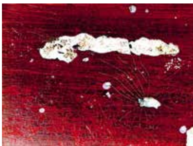
Visuel : Simone Villemeur-Deloume, Le parachute , 1984, Photographie couleur, 30,2 x 40,1 cm, Collection les Abattoirs, Musée - Frac Occitanie Toulouse

Tel : 04 68 27 80 80 | www.laredorte.com | info@laredorte.com