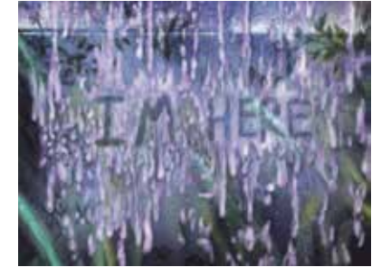
Visuel : Lana Duval, Soleils mouillés , 2020, production pour Horizons d'eaux #4 , parcours réalisé par les Abattoirs, Musée - Frac Occitanie Toulouse et le Frac Occitanie Montpellier

Toulouse (Haute-Garonne) Cale de Radoub 21 juillet – 21 septembre 2020