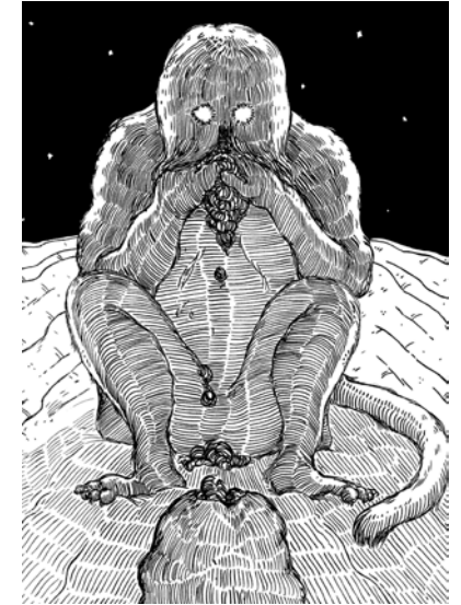
Jimmy Richer, Dessin extrait du roman graphique CASA, 2020 © Jimmy Richer

Jimmy Richer présente CASA, une paléo-fiction traduite sous la forme d'une fresque immense et augmentée d'une sélection d'œuvres de la collection du Frac Occitanie Montpellier, élaborée par l'artiste lui-même en écho à son exposition.