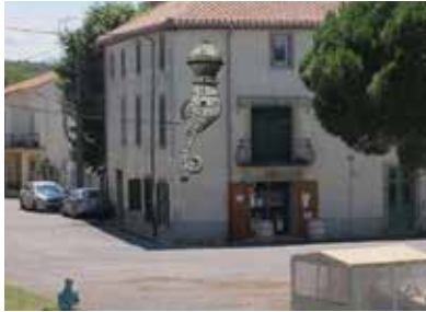
Emilie Losch, Le Colosse Hippocampe , 2020, production pour Horizons d'eaux#4, parcours réalisé par les Abattoirs, Musée - Frac Occitanie Toulouse et le Frac Occitanie Montpellier © Emilie Losch

Affiche dos-bleu, agrandissement x 18 d'un dessin original au stylo encre et feutres alcool sur papier Arche 300 g, 2020